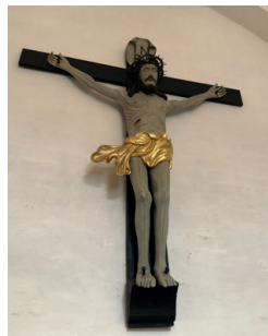
Arkiv foto: Krucifix i Lemvig Kirke

Opstandelsen er ikke skildret på nogen af billederne i Lemvig Kirke. Til gengæld hænger det fantastiske gamle krucifiks i koret ved alteret.