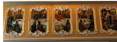
Arkiv foto: Bodil Kaalunds billede i Lemvig Kirke: Nadvermåltid og Nedtagning.

Tilmelding til middagen senest fredag d. 22. marts kl. 12.00 – det koster 100 kr. for voksne og børn under 15 år er gratis.