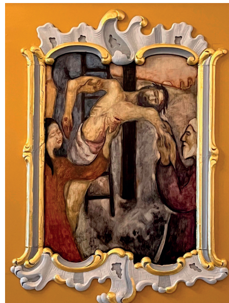
Billedet hvor Jesus tages ned af korset er malet af Bodil Kaalund og er en del af Nordpulpituret i Lemvig kirke.

det levende lys – da sang det i fugle og træer, ja i alt der levede og åndede: "Af jorden skal du igen opstå!"