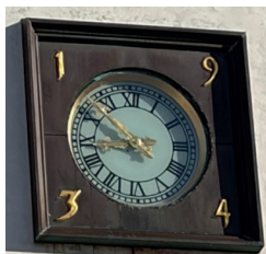
Lemvig Kirkes ur

Nostalgien samler sig også omkring Lemvig Kirke. Kirkens tårn-ur er fra 1878, fremstillet af urmager P. N. Kastberg i Lemvig. Tårnuret blev trukket af et mekanisk urværk fremstillet i Tyskland og har fungeret fint indtil menighedsrådet besluttede, at kirketjeneren ikke længere en gang om ugen skulle bevæge sig op i tårnet og trække urværket op, som et gammeldags "bornholmerur". Nu foregår optrækningen af tårnuret via automatik. Et stykke kirkehistorie i Lemvig er slut.