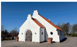
Kapellet på Lemvig Kirkegård